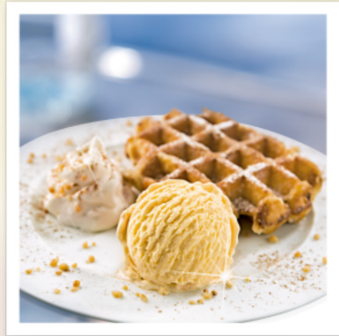
Eis und Waffel Mit Früchten und Schlagobers garniert. € 7.50